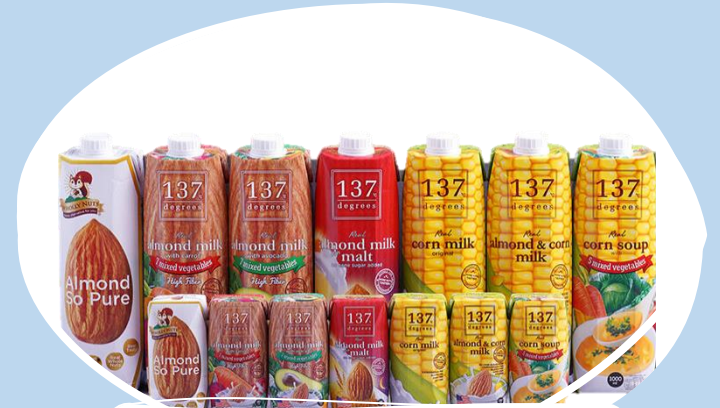
กล่องนมธัญพืช