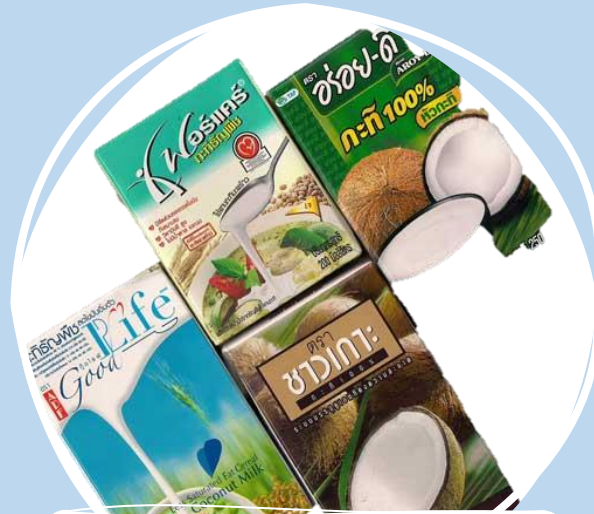
กล่องน้ำกะทิ