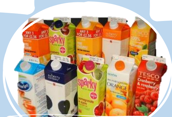
กล่องน้ำผลไม้