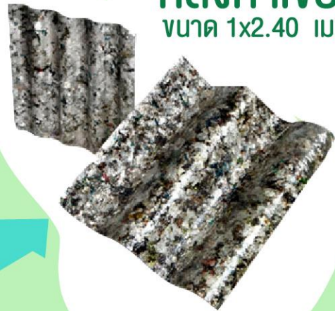
หลังคาเขียว ขนาด 1x2.40 เมตร