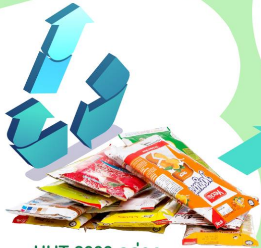
UHT 2000 กล่อง กล่องเครื่องดื่ม

กล่องเครื่องดื่มที่ไม่ใช้แล้ว รีไซเคิลเป็นหลังคาเขียว กันแดดและหลบฝน ให้ใครอีกหลายคนได้นะ