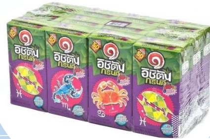
กล่องชาพร้อมดื่ม